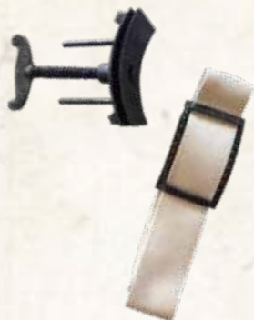
Škrtidlo, tzv. turniket