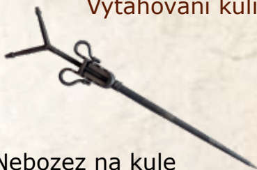
Nebozez na kule