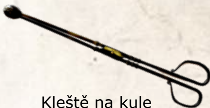
Kleště na kule